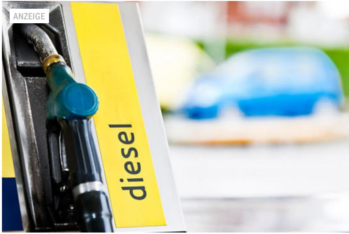
myRight mit besserem Angebot als VW-Vergleich myRight