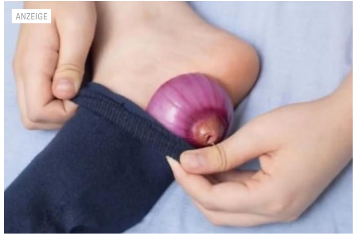
Sie steckt nachts eine halbe Zwiebel in eine Socke. Du wirst nicht glauben was am... Tippsundtricks.co