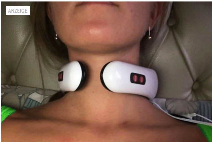
Die einfache Möglichkeit Nacken- und Rückenschmerzen zu lindern wird Sie...